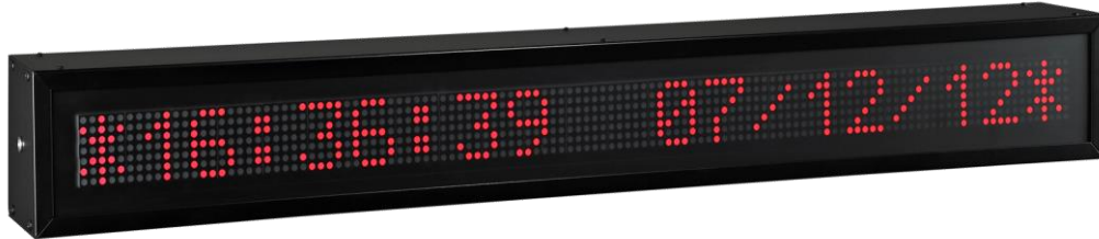
DT-110 (CHAR H 100MM)