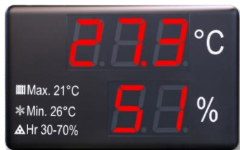
DC-20 (REAL DECRETO 1826/2009)