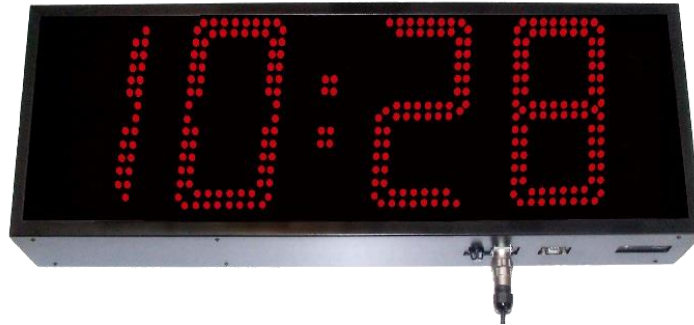
DR-129 (CHAR H 250MM)