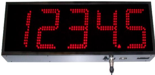
DN-189 (CHAR H 180MM)