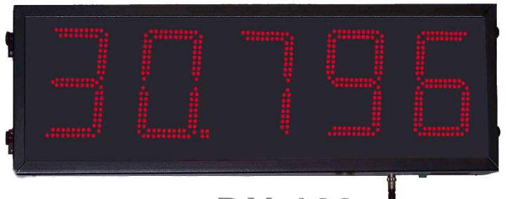
DN-129 (CHAR H 250MM)