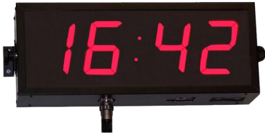
DR-119 (CHAR H 100MM)