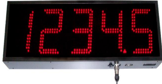
DR-189 (CHAR H 180MM)